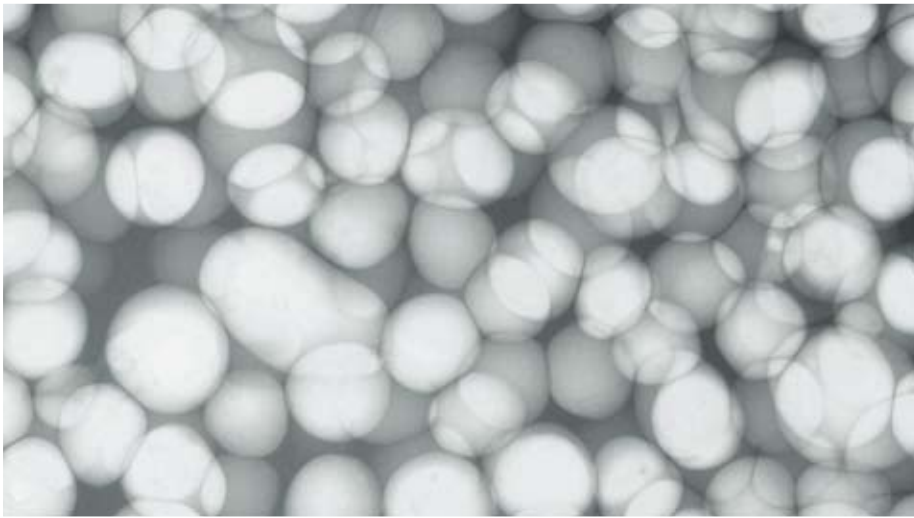
▲ Röntgenbild eines Metallschaums

Für ihre Versuche haben die Wissenschaftler ein transportables Labor in der Größe eines Umzugskartons gebaut. Darin: ein Ofen, in dem der Metallschaum erzeugt wird und eine Röntgenanlage, die die Evolution des Schaums festhält. Die mitgebrachten Filme zeigen, was mit dem flüssigen Schaum während des Fluges passiert: bei starker Erdanziehung bildet sich am unteren Rand des Schaums ein großer Tropfen flüssigen Metalls. In Schwerelosigkeit verschwindet der Tropfen sofort – seine Flüssigkeit verteilt sich gleichmäßig über den gesamten Schaum.