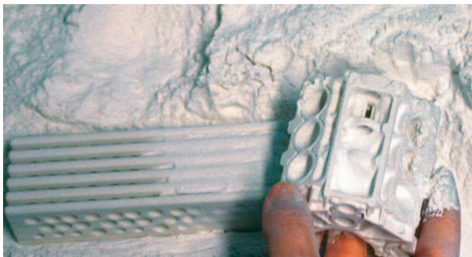
▲ Schneller Prototypenbau: Durch den 3D-Druck reduzieren sich die Entwicklungszeiten für keramische Produkte erheblich